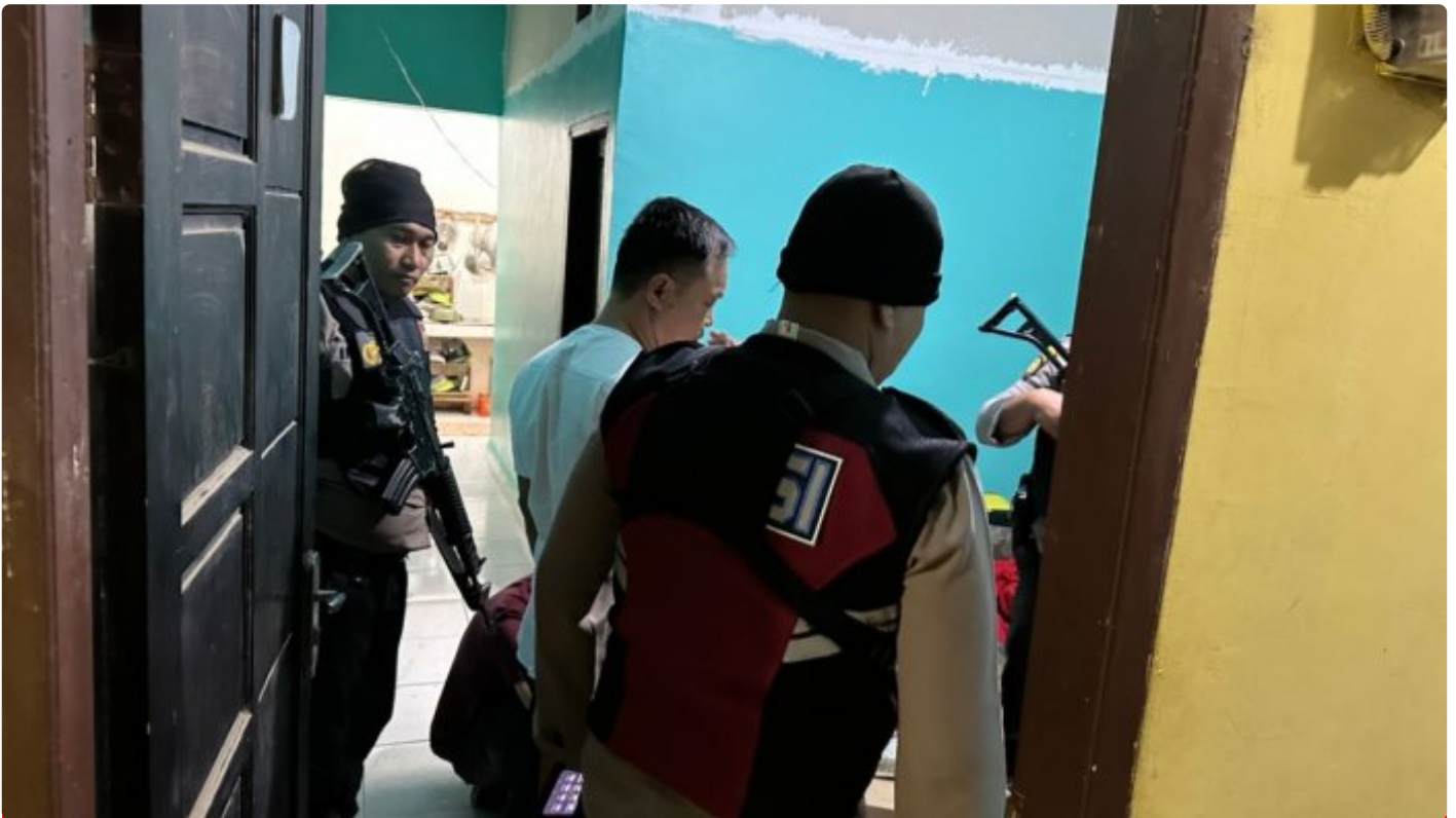
Tampak aparat kepolisian Morowali lakukan razia

MOROWALI, Sulawesi Tengah- Kepolisian Resort (Polres) Morowali tidak Panas Panas Tai Ayam, merespon cepat dan menindak tegas keluhan dari para tokoh masyarakat terkait peredaran Minuman Keras (Miras) yang selama ini cukup meresahkan di wilayah kecamatan Bahodopi, Kabupaten Morowali.