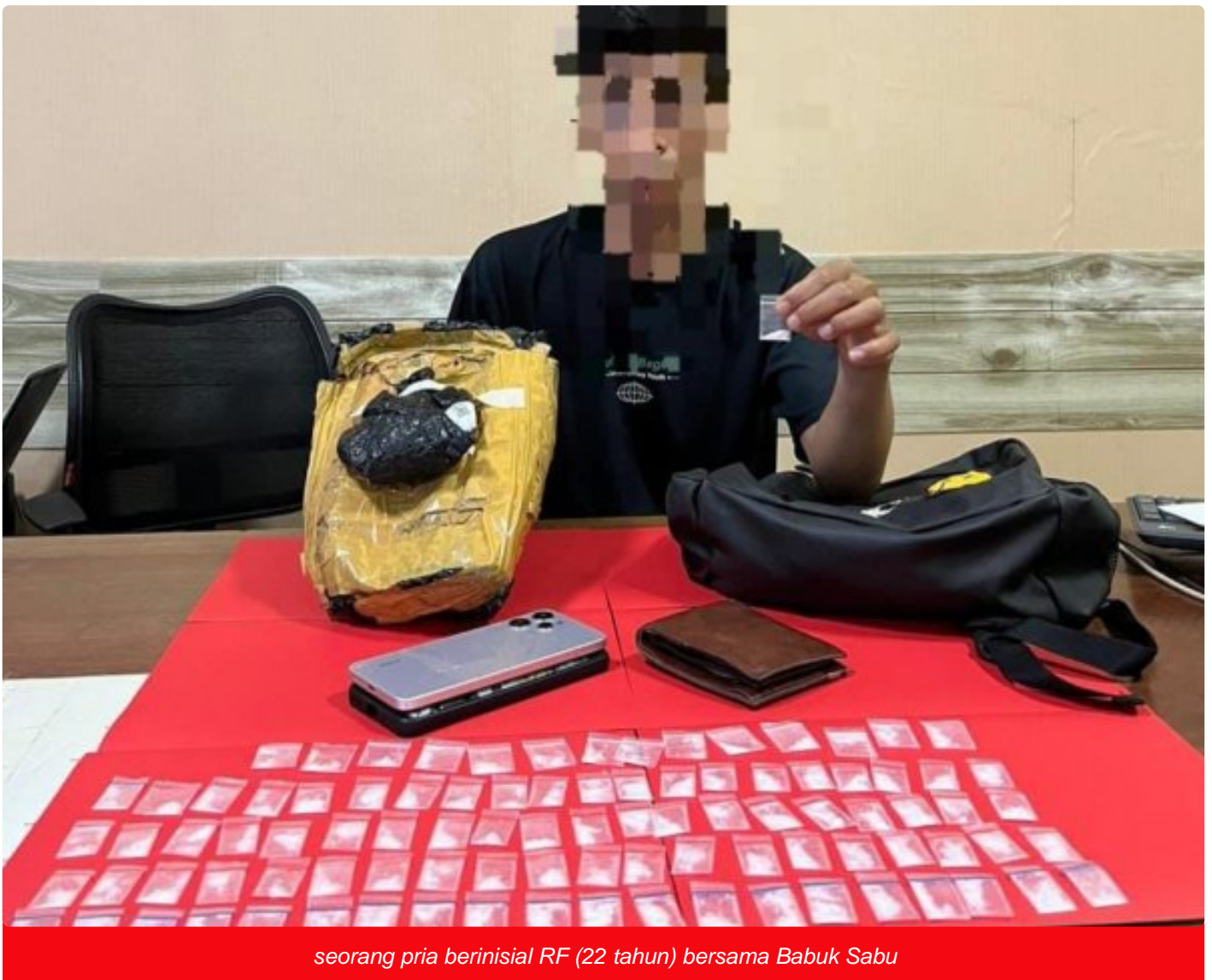
seorang pria berinisial RF (22 tahun) bersama Babuk Sabu

MOROWALI, Sulawesi Tengah- Personel Satuan Reserse Narkoba (Satresnarkoba) Polres Morowali kembali menunjukkan komitmennya dalam