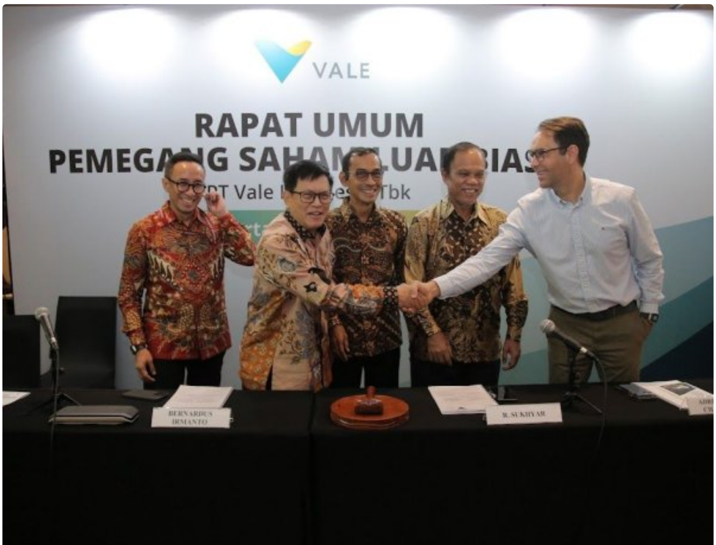
PT Vale Selenggarakan RUPSLB

Jakarta, 28 Maret 2024 – PT Vale Indonesia Tbk (“PT Vale” atau “Perseroan”, IDX Ticker: INCO) hari ini menyelenggarakan Rapat Umum Pemegang Saham